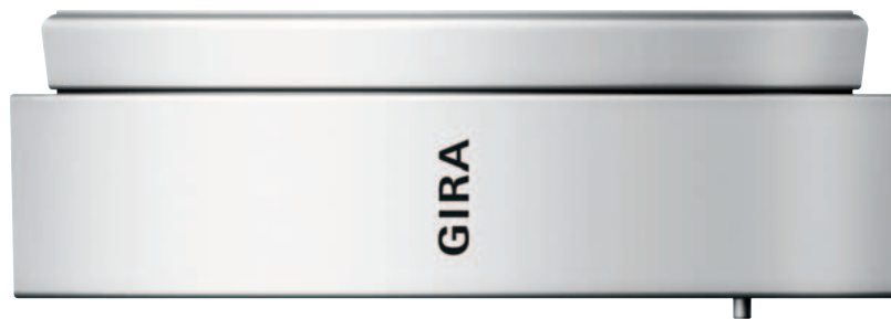
Gira Rauchmelder basic/VdS Reinweiß, Abbildung 1:1