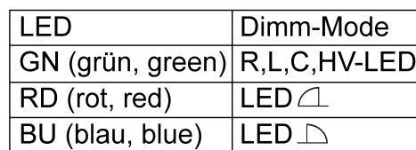
Afbeelding 3: Toewijzing LED-kleur aan dimprincipe