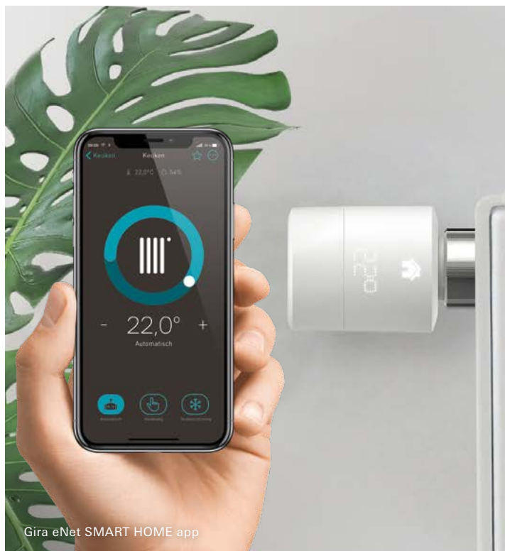
Gira eNet SMART HOME app