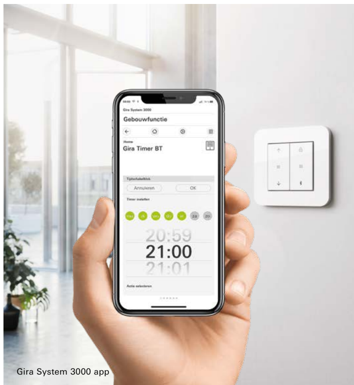
Gira System 3000 app