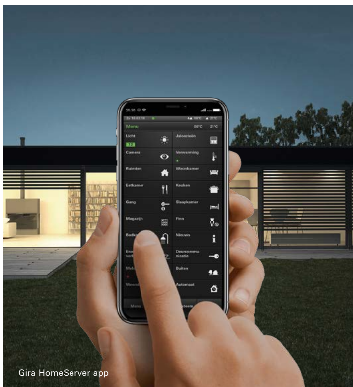
Gira HomeServer app